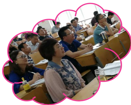
瞧，校长们听课多用心呀！