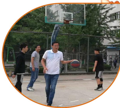
飒爽英姿不减当年啊！