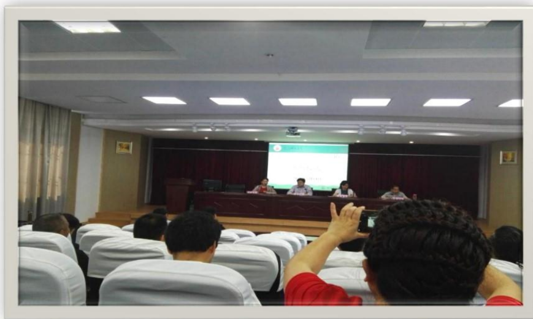
开班仪式简洁而又不失隆重