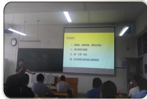
安师大教科院教授 李宜江 (校长的领导力及其提升)