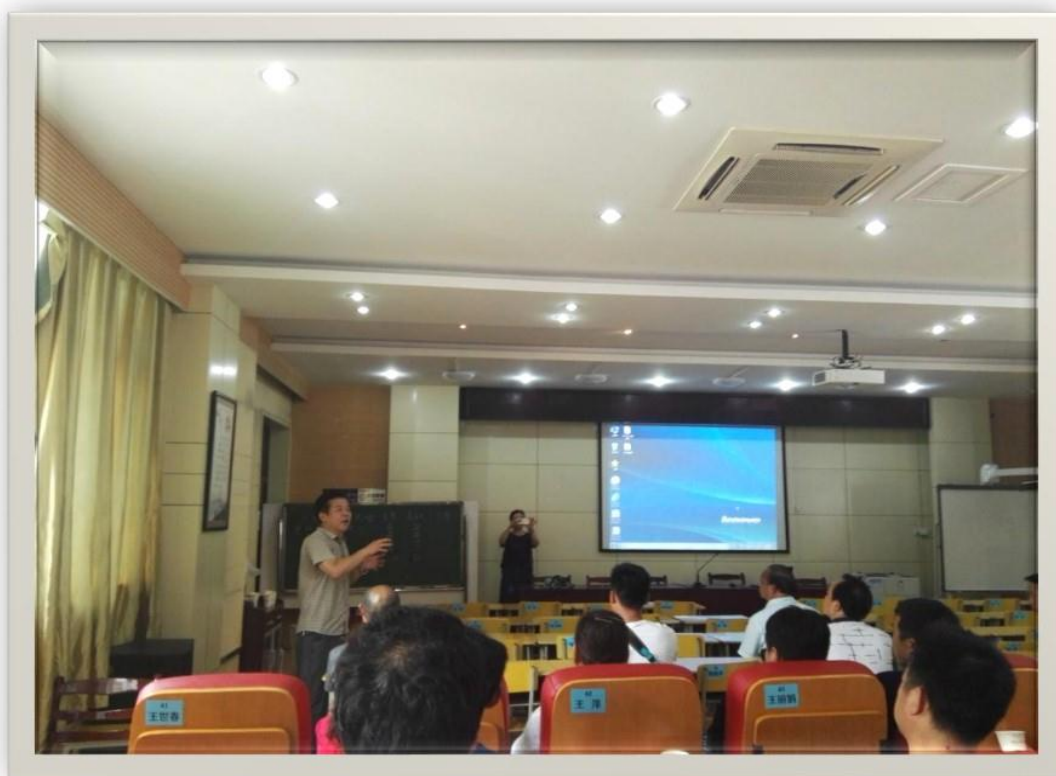
班主任家长般的亲切关怀如沐春风