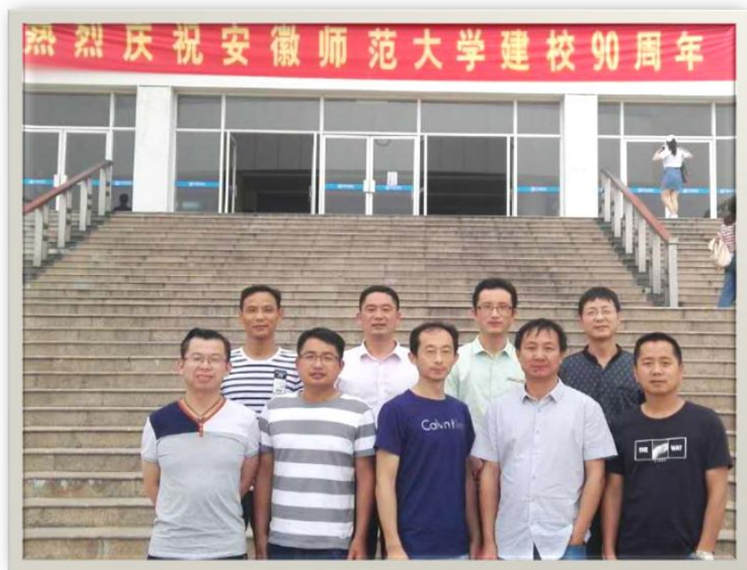
绩溪、旌德、郎溪三县培训学员