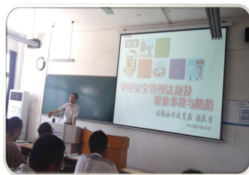
马鞍山教育局副局长 汪久生 (学校安全教育与管理)